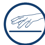
PRZYJAZNY DLA SKÓRY