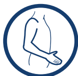
ORTEZA KOŃCZYNY GÓRNEJ