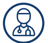
POLECANY PRZEZ SPECJALISTÓW

www.reh4mat.com e-mail: biuro@reh4mat.com