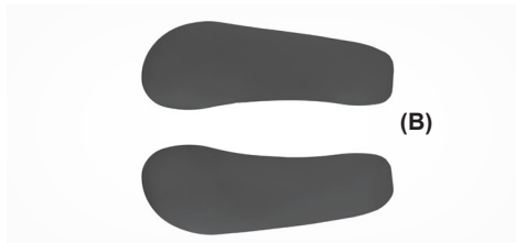
B. ŁUSKI O MOCNYM STOPNIU STABILIZACJI B. STRONG STABILIZATION SHELLS