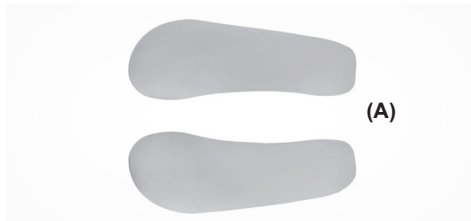
A. ŁUSKI O ŚREDNIM STOPNIU STABILIZACJI A. SOFT STABILIZATION SHELLS