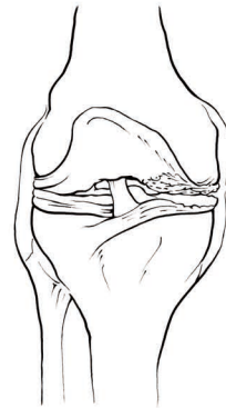
STAW ZAATAKOWANY PRZEZ OSTEOARTROZĘ